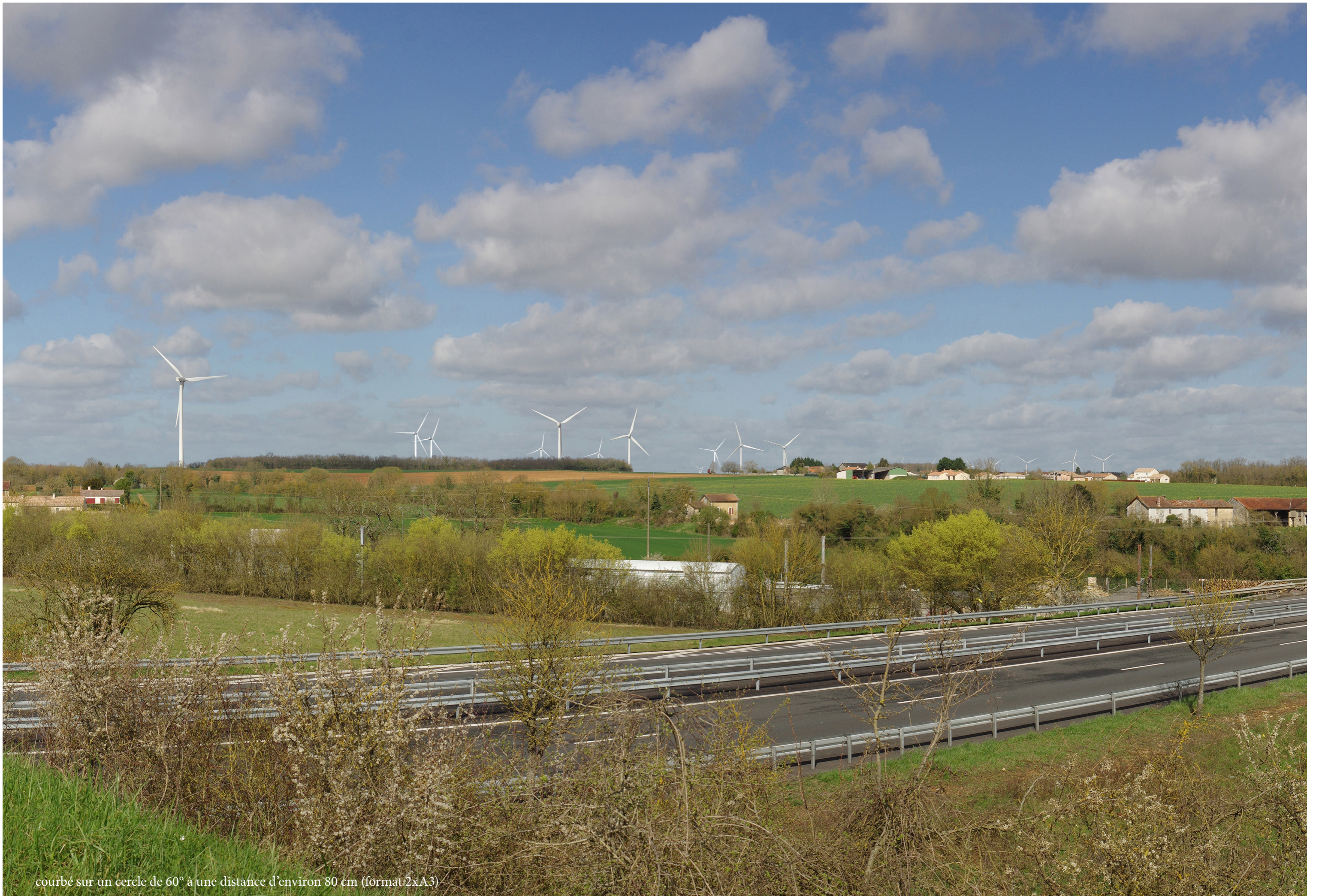
courbé sur un cercle de 60° à une distance d'environ 80 cm (format 2x A3)