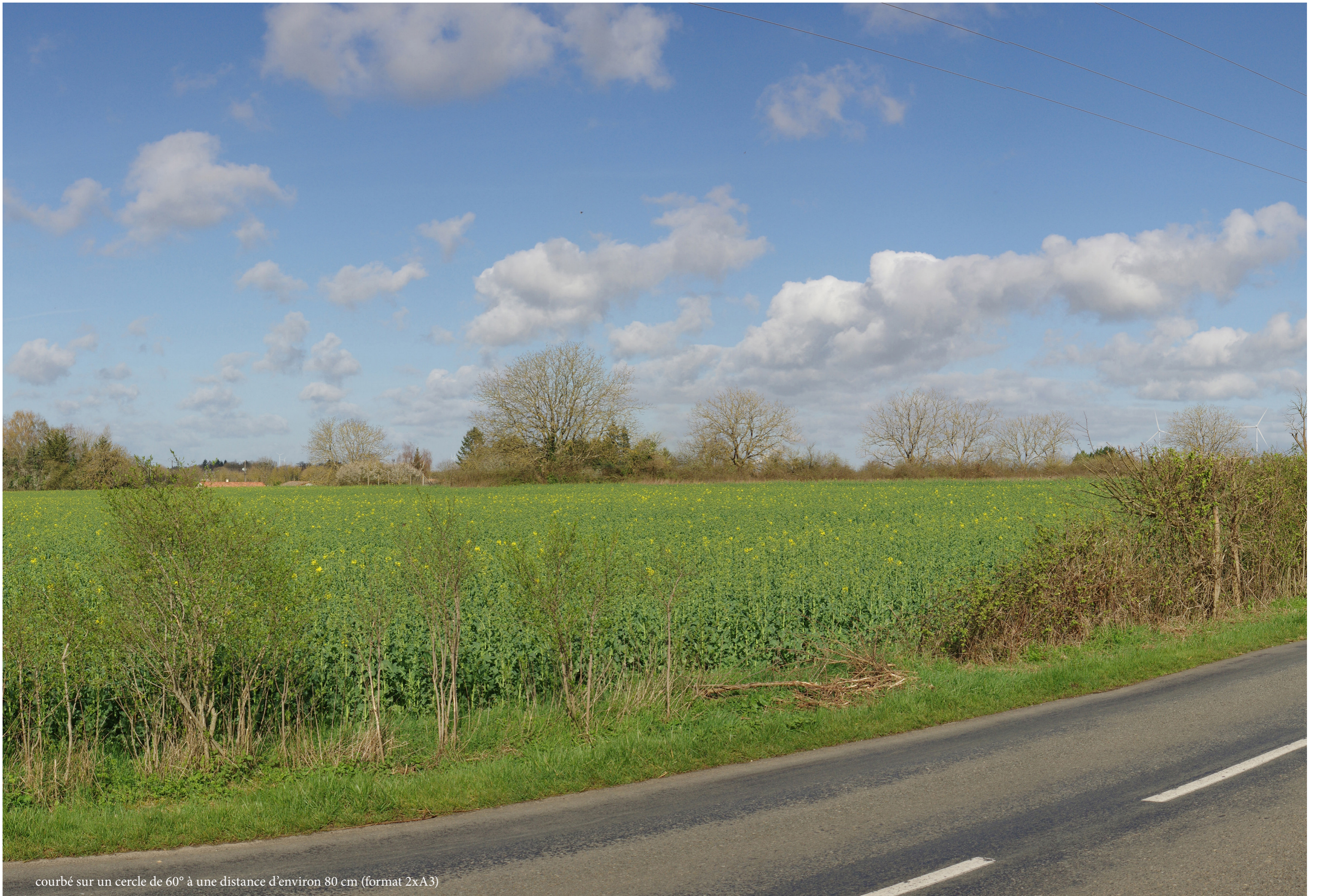
courbé sur un cercle de 60° à une distance d'environ 80 cm (format 2xA3)